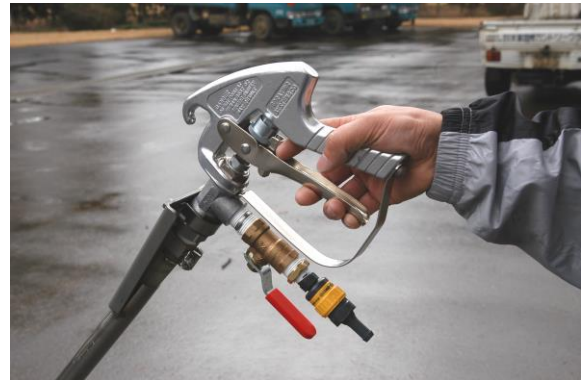
散布時のハンドルレバーのロック