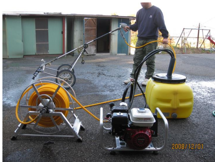
スプレーマスターと小型動力噴霧器の組合せ