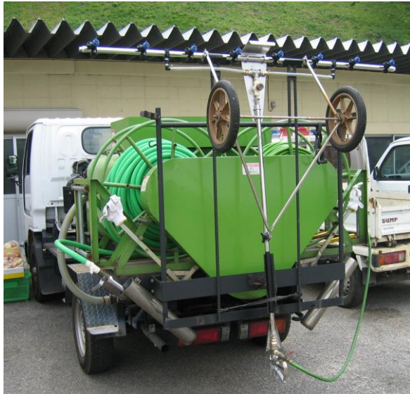
タンク車への搭載