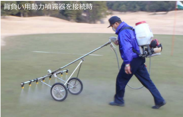
背負い用動力噴霧器を接続時